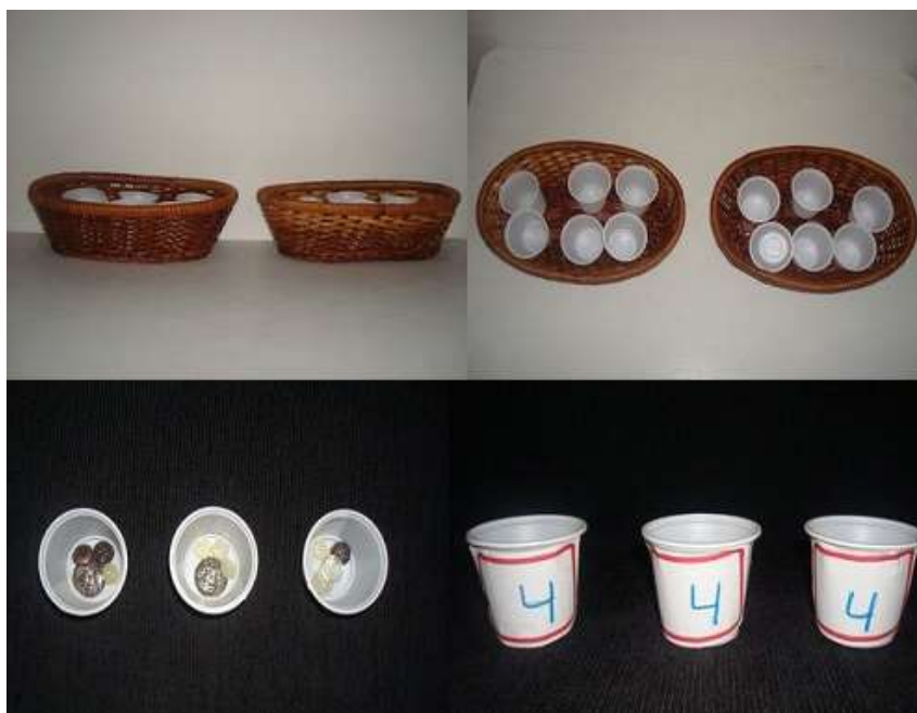
FIGURA 3: Copinhos da multiplicação