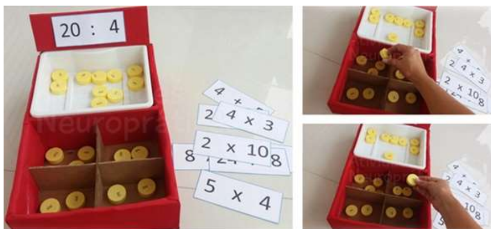
FIGURA 4: Brincando com a divisão.