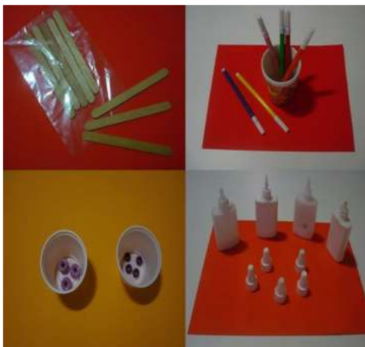
FIGURA 2: Subtração com material concreto.

O educador pode utilizar os materiais que são de fácil acesso e que faz parte da rotina da sala, e ensinar de forma lúdica, propondo situação-problema e instigando o aluno a buscar resolução do problema. O professor, como mediador, acompanhará o desenvolvimento dos alunos e poderá fazer intervenções para a melhor compreensão dos mesmos.